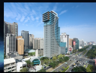
高雄美術館園區HH大樓