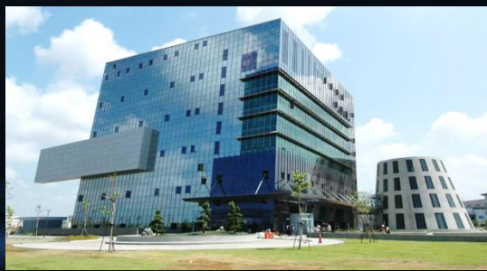
益通光能國際營運總部暨廠辦大樓