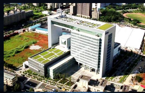
民視林口數位媒體總部大樓